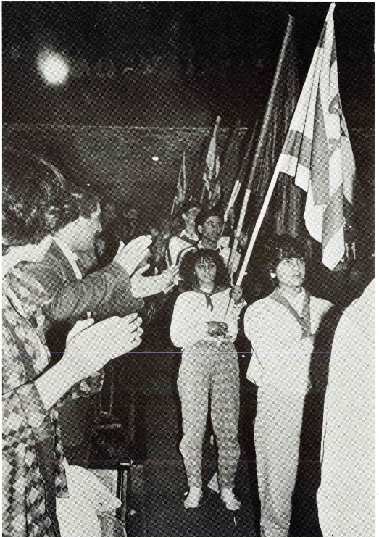
חברי ברית הנוער הקומוניסטי נושאי הדגלים בערב הפתיחה