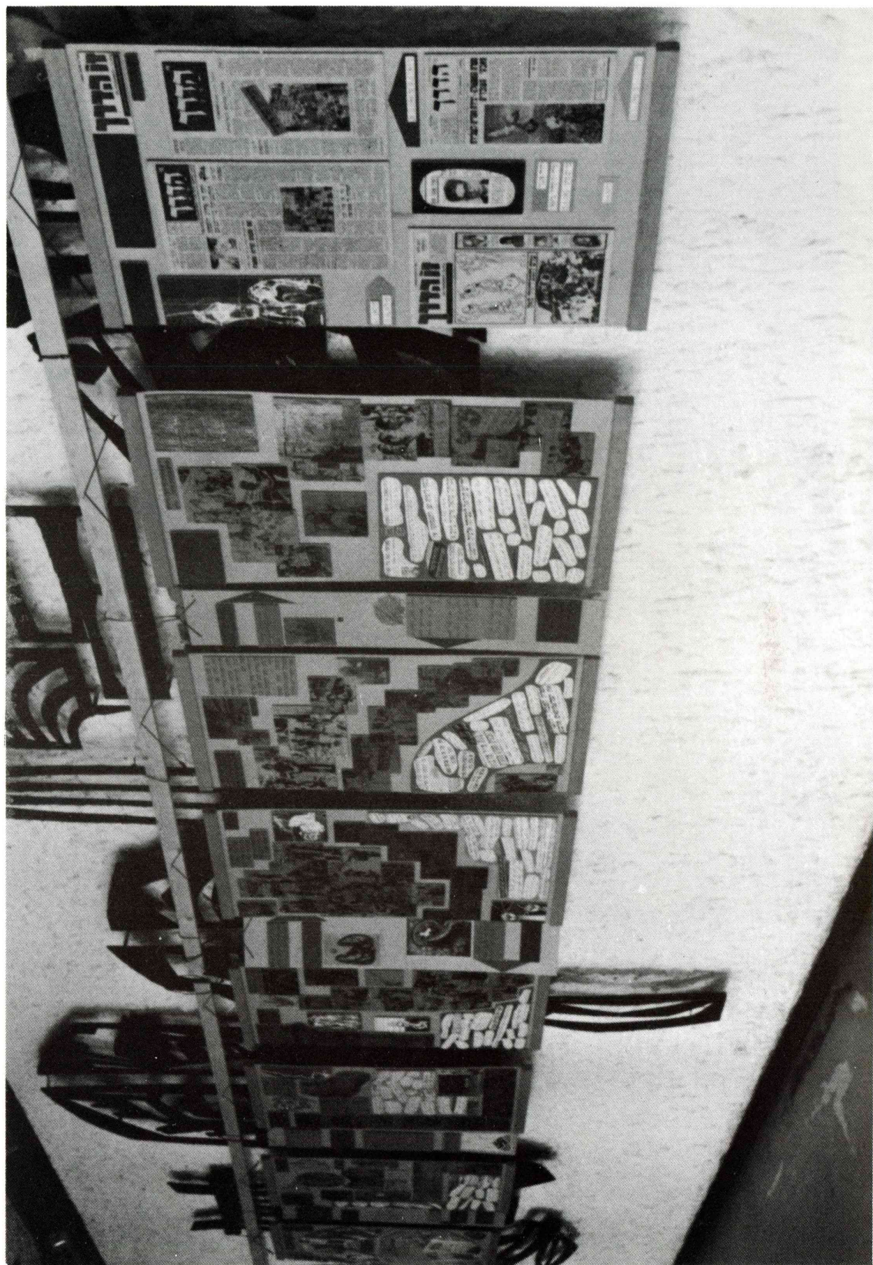
הערוכת העתונות הקומוניסטית, שהוכנה לרגל מלאות 20 שנה לשבועון "זו הדרך", והוצגה באולם הכניסה של אולם "שביט"