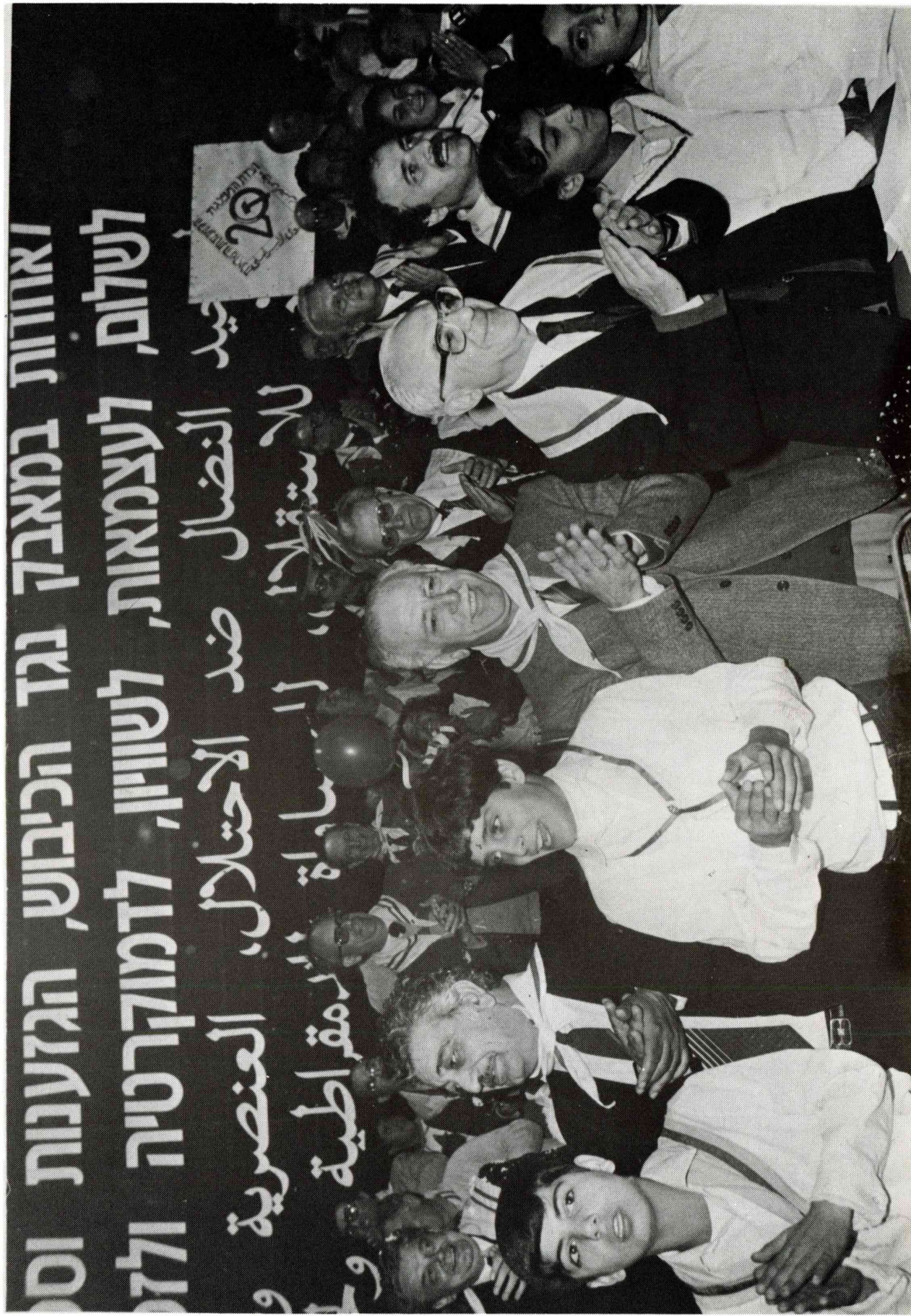
נשיאות הוועידה בעת ברכת בני עמל